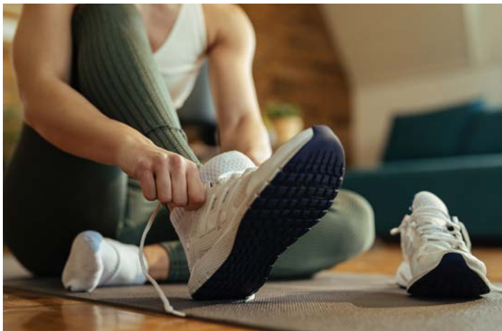
SALLE DE FITNESS

Vous aurez accès à la piscine, mais aussi au sauna et au hammam, tout au long de votre séjour. L'occasion de profiter de purs moments de détente.