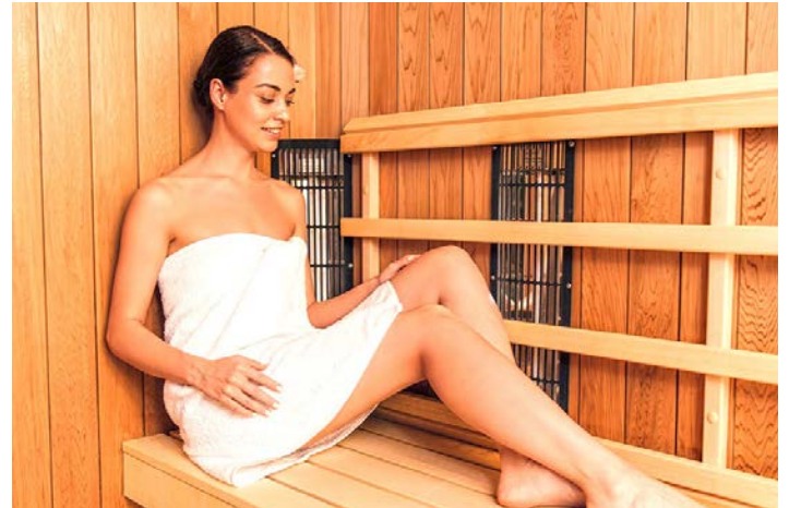
SAUNA ET HAMMAM

Pour allier sport et détente, faire de l'aquagym est idéal. Quel que soit l'effort, le contact avec l'eau crée une sensation de massage pour garder la forme.